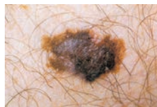
Hautkrebs verdächtig (asymmetrisch, unregelmäßig begrenzt, helldunkel pigmentiert, größer als 5 mm)

Wenn Sie eines dieser Merkmale entdecken, sollten Sie den Haus-/Hautarzt aufsuchen. Dies gilt auch für alle Hautveränderungen, die nach etwa 6 Wochen noch jucken, bluten, nicht abheilen.